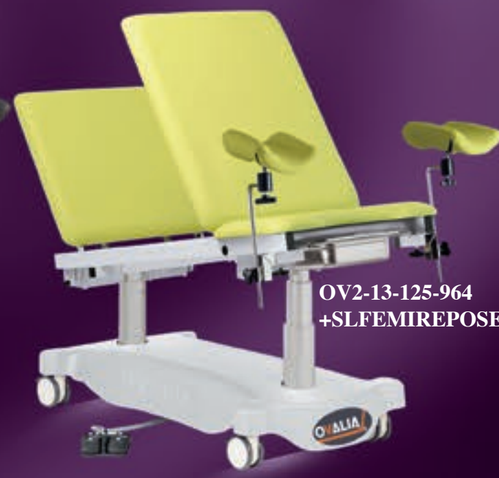
OV2-13-125-964 + SLFEMIREPOSE