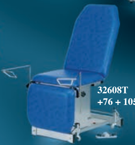
32608T +76 + 105 +997