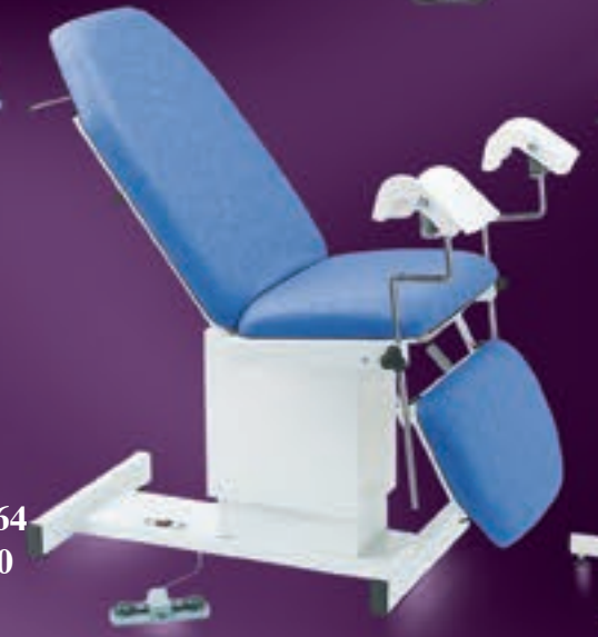
62504T + 964