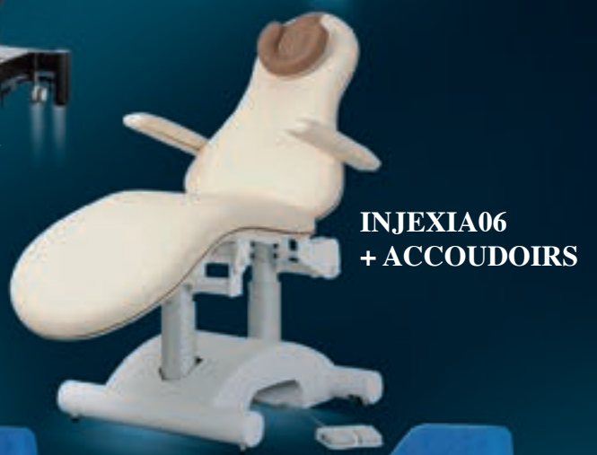
INJEXIA06 + ACCOUDOIRS