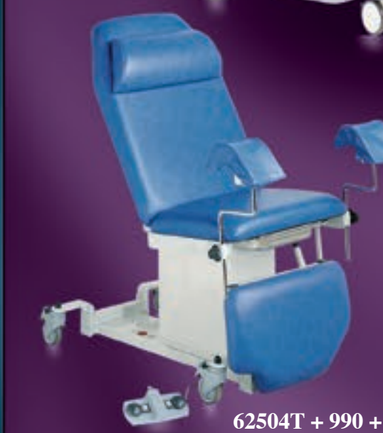
62504T + 990 + 964 + SLO964 + 32660